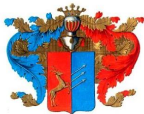
Герб дворянского рода Наумовых