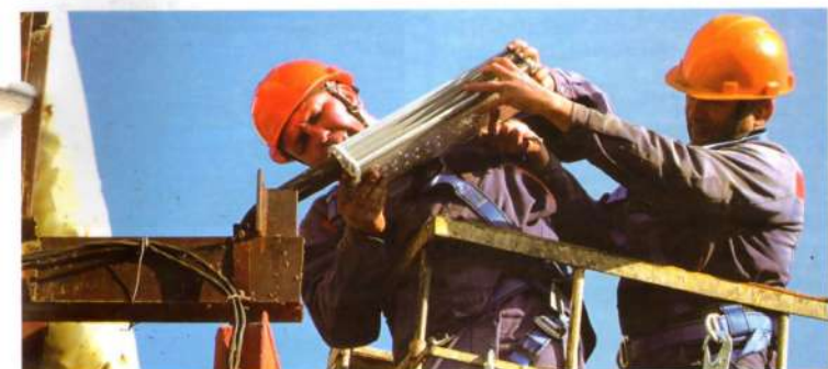
Установка светильников на территории завода

Работники электрического цеха реализовали на территории завода локальный энергосервисный проект: оборудовали главную заводскую дорогу яркими и энергоэффективными фонарными светильниками.